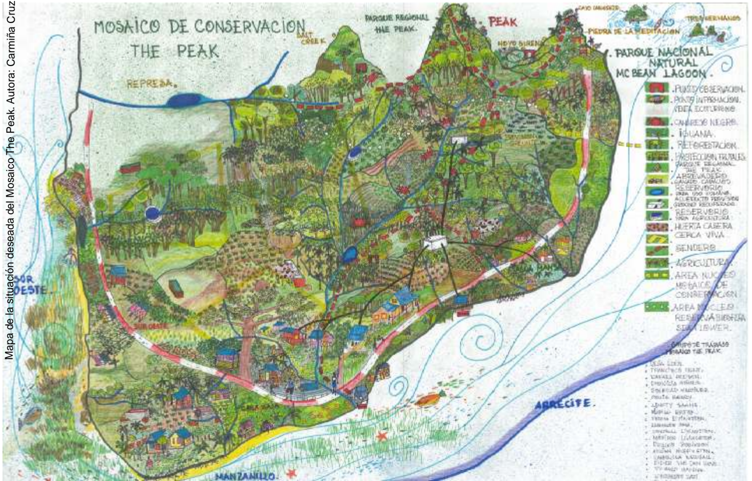
Mapa de la situación deseada del Mosaico The Peak. Autora: Carmiña Cruz

COMUNIDADES E INSTITUCIONES DECIDIENDO SOBRE LA CONSERVACIÓN Y USO SOSTENIBLE DE LA BIODIVERSIDAD DE SU TERRITORIO