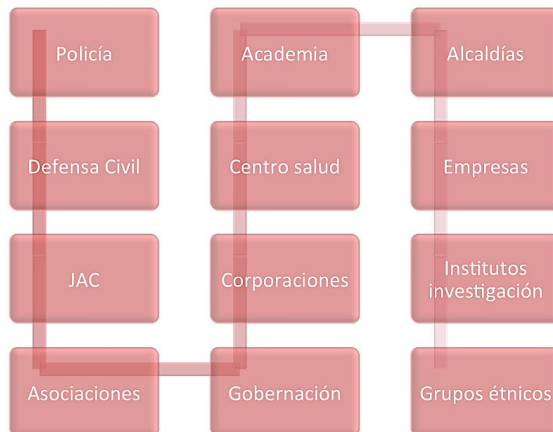
Figura 1. Actores del área de influencia de la Reserva Natural Río Ñambí.

En el marco del proyecto “Construcción Participativa del Plan de Manejo de la Reserva Natural Río Ñambí”, se hizo un análisis de actores con el propósito de valorar las diferencias, fortalezas y su accionar, para definir elementos estratégicos que permitan a la Reserva Natural Río Ñambí RNRÑ, consolidar, articular y fortalecer las alianzas institucionales, comunitarias, gubernamentales y no gubernamentales a nivel nacional e internacional. Lo anterior con el objetivo de definir la participación y el relacionamiento de los diferentes actores en el cumplimiento de las metas propuestas en el plan de acción de la RNRÑ. Este análisis nos permitirá definir además cuales son los actores estratégicos de mayor relevancia, cuales de ellos son esporádicos, cuales debemos fortalecer y en que sector y cual es el nivel de relacionamiento de cada uno de ellos con la RNRÑ y la Fundación FELCA.