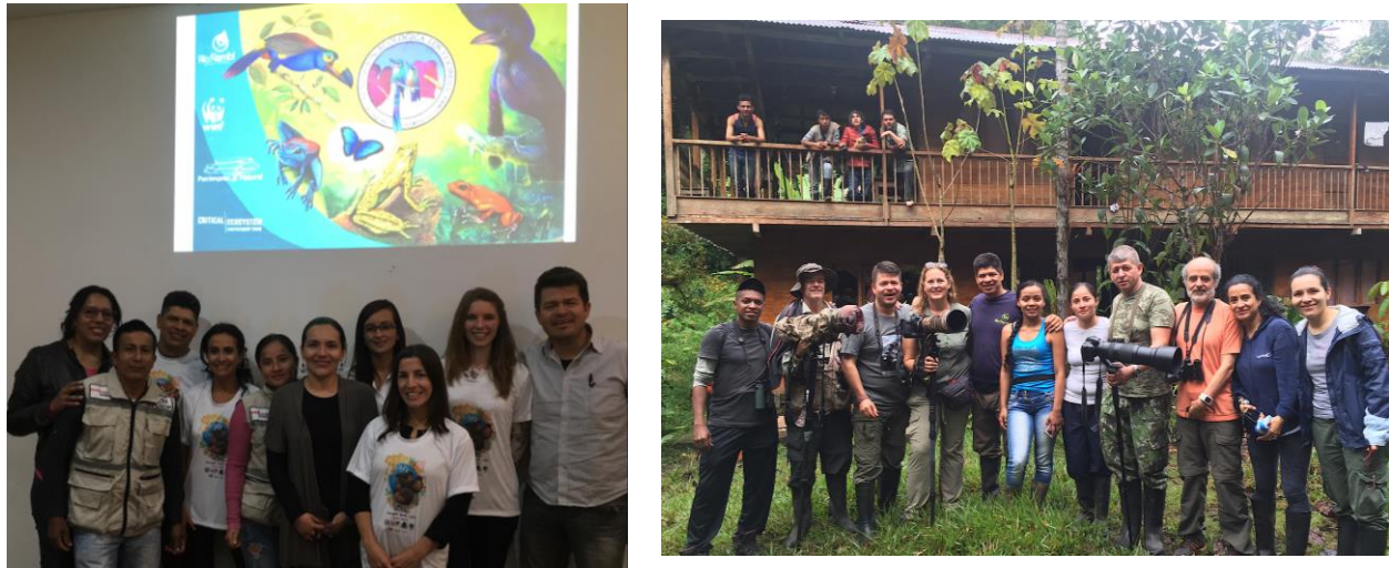
Figura 2. Equipo coordinador CEPF y equipo Fundación FELCA-RNRÑ (Izquierda). En labores de campo (derecha).